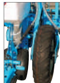
Nastaviteľné hnacie koleso.