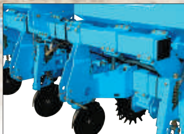
7" TOP rám

TOP rám – nový pevný, stabilný a odolný rám. Jeho najdôležitejším znakom je nosník 7" x 7". Výsevné jednotky sú montované na tomto masívnom ráme. Vysoká hmotnosť rámu zaisťuje dostatočné vnikanie do pôdy. Ak je potrebné rám môže byť doťažený. Štandardným príslušenstvom sú náhonové kolesá veľkého priemeru (7.60x15). Tieto kolesá sú výškovo nastaviteľné pre optimálnu pracovnú výšku rámu.