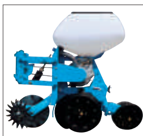
NX výsevná jednotka