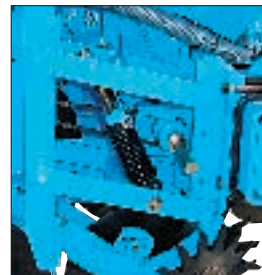
Parallélogramme large et compact avec ressorts réglables