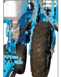
Roues porteuses réglables en hauteur