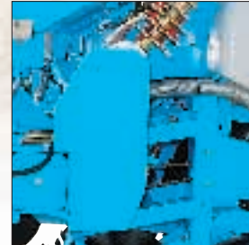
Getriebe für den Sääntrieb an der linken Seite, mit austauschbaren Zahnradern