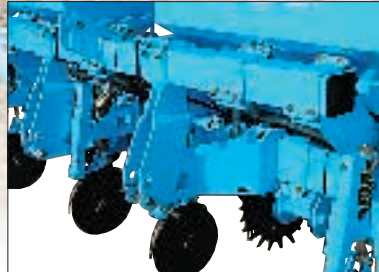
7" TOP Rahmen

Der neue TOP Rahmen, für noch mehr Stabilität und Robustheit, ist vollkommen neu. Der wichtigste Vorteil von diesem neuen Rahmen, ist der 7" x 7" Grundrahmen. Das Gewicht des Grundrahmens verleiht der NX Einzelkornsämaschine einen hohen Eindringdruck. Wenn es notwendig ist, kann der Rahmen noch extra belastet werden. Der TOP Rahmen besitzt als Standardausrüstung Antriebsräder (7,60 x 15) mit großem Durchmesser. Diese Räder können in der Höhe verstellt werden, um eine optimale Tiefenführung bei der Säarbeit zu erreichen.