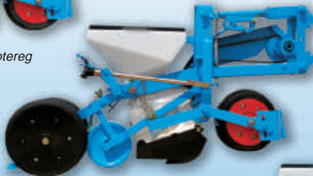
MECA V4 Tandem systeem