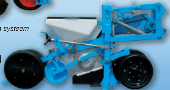
MECA V4 Dubbele schijven