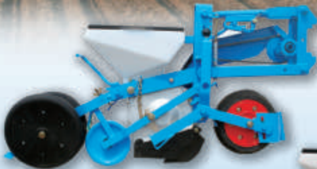
MECA V4 Frontwiel dieptereg (Standaard)