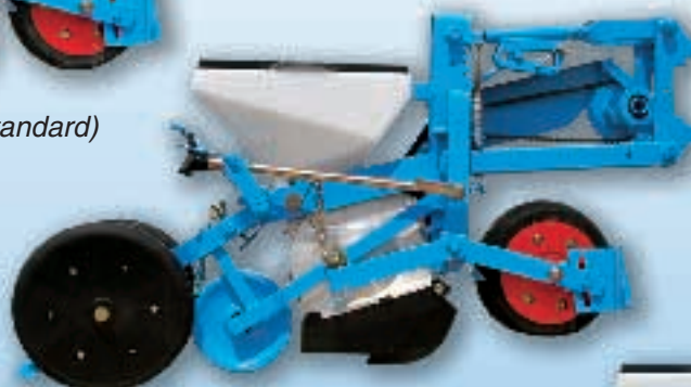
MECA V4 Balancier