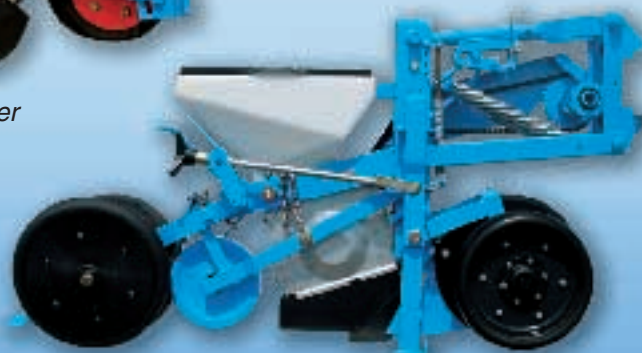
MECA V4 Double-disques