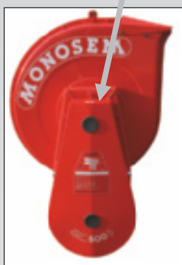
Turbine Grand Débit Gd