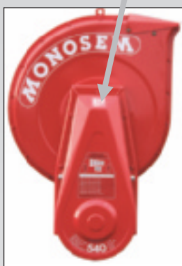
Turbine standard Std