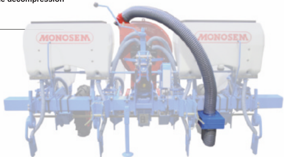
Exemple de montage du kit KAP sur semoir Monosem NC 4 rangs maïs avec turbine Std.