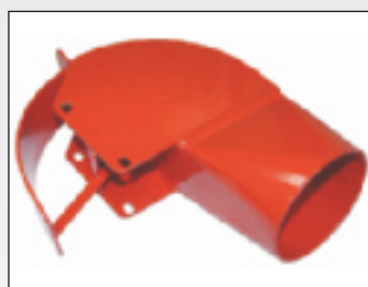
Collecteur pour turbine PNU