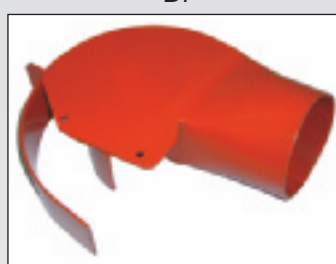
Collecteur pour turbine Df