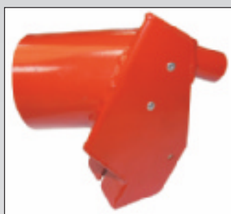
Collecteur pour turbine Std et Gd